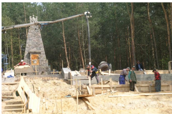
Fot. Stan pomnika z maja 2010 r.

solidna konstrukcja żelbetowa, a wszystkie płaszczyzny schodów ponad poziomem gruntu zostały wyłożone płytami granitowymi. Schody i teren wokół pomnika zostały