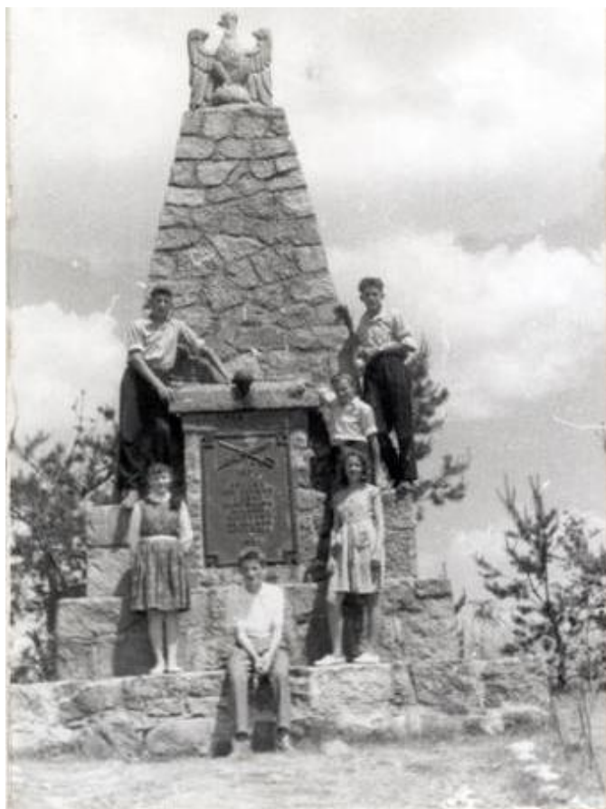
Fotografia archiwalna, brak danych

Mieszkańcy Stoczka i okolic bardzo upodobili sobie Pomnik Bitwy pod Stoczkiem. Przez minione 80 lat (od czasu jego budowy) był często odwiedzany przez różne wycieczki i grupy turystyczne a w uroczystych chwilach składane były tam kwiaty i organizowane uroczystości patriotyczne.