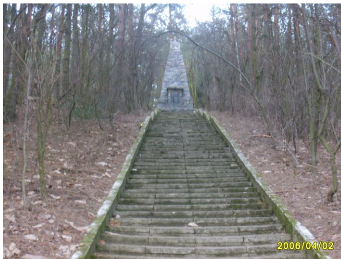
fot. Pomnik sprzed renowacji